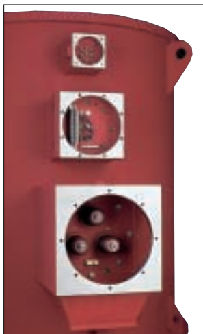
Haupt- und Hilfsanschlusskästen in Zündschutzart Exd IIC