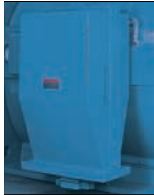
Standard-Anschlusskasten U_N=10\text{kV} ,