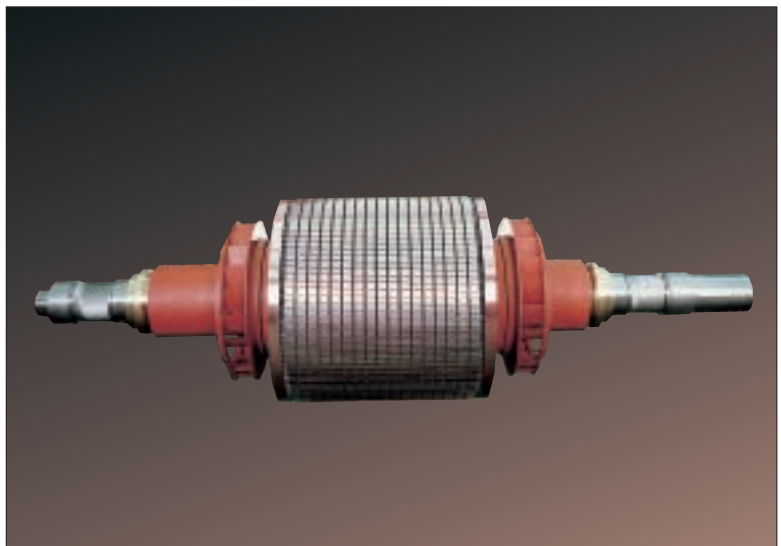
Läufer mit Kupferkäfig

Durch entsprechende Gestaltung der Nutform sind höhere Anzugsmomente und Anpassungen an gewünschte Drehmomentenverläufe erreichbar.