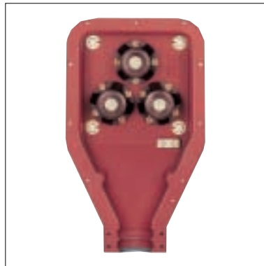
Anschlusskastenunterteil mit Gießharzdurchführungen, 6kV

Um ein Höchstmaß an Sicherheit zu garantieren, werden die Anschlusskästen aus nicht splinternden Werkstoffen gefertigt. Es werden Gießharzisolatoren nach DIN 46264 mit einer hohen Biege- und Torsionsfestigkeit eingesetzt. Sollbruchstellen, die wahlweise nach oben oder zur Maschinenseite gerichtet angebracht werden können, sorgen im Störfall für eine gezielte Ableitung der Druckenergie.