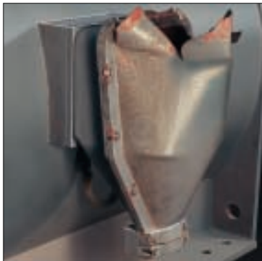
Standard-Anschlusskasten U_N=6\text{kV} , Sollbruchstelle geöffnet