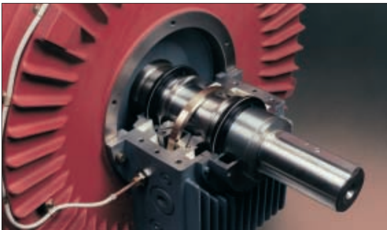
Gleitlagerausführung mit Eigenkühlung