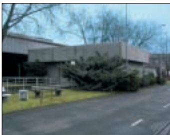
Prüflabor für Explosionsschutz

Zünddurchschlagsprüfung mittels Druckkessel für Prüflinge mit einem Durchmesser bis zu 1,6 m ( \leq Typ 60..)