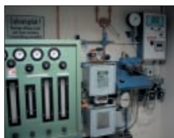
Aggregat zur Mischung und Überwachung des Zündmediums

Zünddurchschlagsprüfung im Haubenverfahren (Prüfkalotte) für Prüflinge mit einem Durchmesser über 1,6 m ( > Typ 60..)