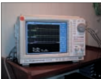
Auswertung der transienten Druckereignisse