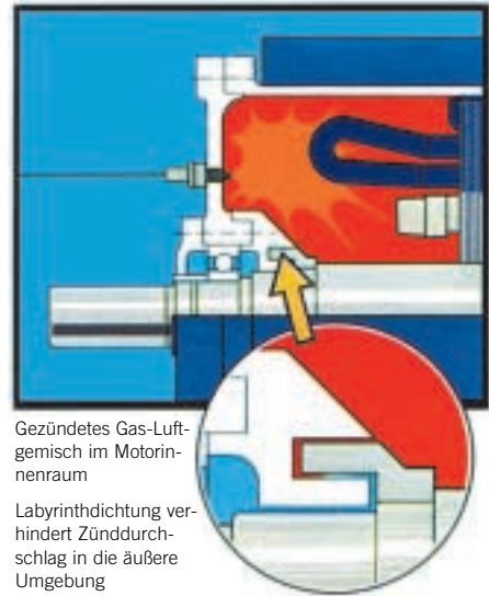
Gezündetes Gas-Luftgemisch im Motorinnenraum

Die Prüfungen werden in Gegenwart des Vertreters einer amtlichen Prüfstelle vorgenommen und in einem Prüfbericht bescheinigt.