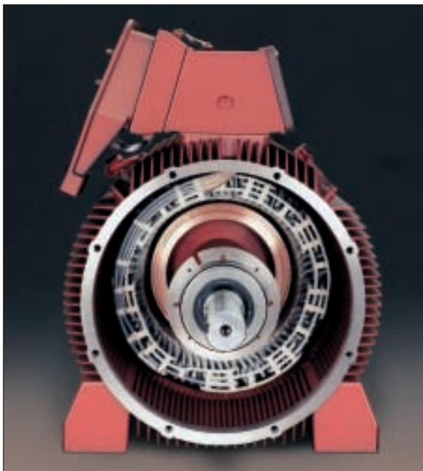
Ansicht auf Wickelkopf-Schaltseite