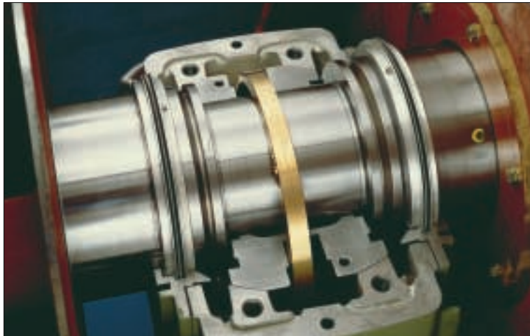
Gleitlagerausführung mit Eigenkühlung