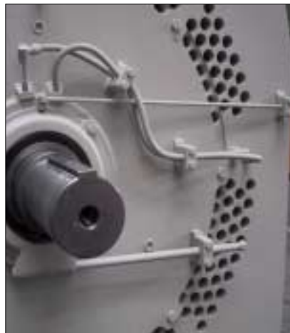
Wälzlager mit Nachschmiereinrichtung und Fettentnahmevorrichtung

Die äußeren Lagerdeckel haben einen Aufnahmeraum für das Altfett und ggf. eine Fettentnahmevorrichtung.